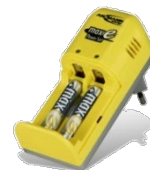
Chargeur et accumulateurs