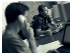
Contrat d'entretien pour votre tranquillité